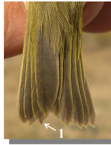
Ageing. Autumn. 1st year. Tail pattern: feathers pointed with brown tinge (1). Edad. Otoño. 1º año. Diseño de la cola: plumas con punta aguda y tinte pardo (1).

Zucca, M., 2017. Évolution récente du statut du Pouillot à grands sourcils Phylloscopus inornatus en France. Ornithos , 24-4: 201-223