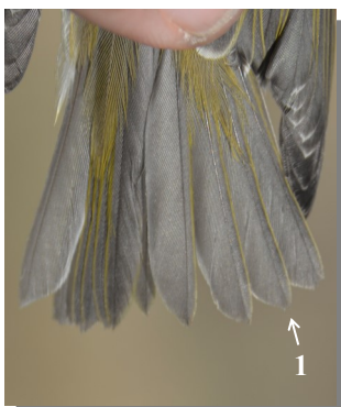
Ageing. Autumn. Adult. Tail pattern: with broad tips and blackish tinge (1).