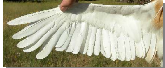
Garcilla cangrejera. Adulto: diseño del ala (26-VII).