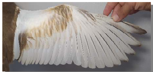
Garcilla cangrejera. Determinación de la edad. Diseño del ala: arriba adulto; centro 2º año ; abajo juvenil