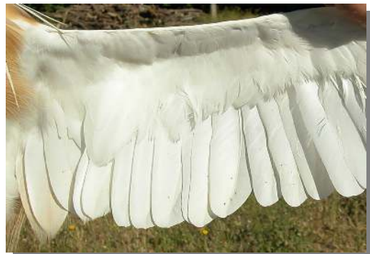
Garcilla cangrejera. 2º año: diseño de primarias ().