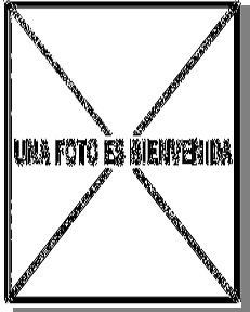
Garcilla cangrejera. Diseño de la nuca: arriba izquierda adulto (26-VII); arriba derecha 2º año (); izquierda juvenil ().