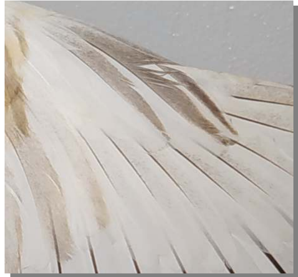
Garcilla cangrejera. Juvenil: diseño de coberteras primarias (14-IX)