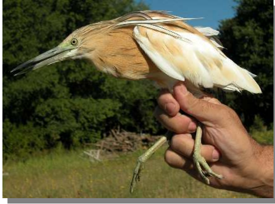
Garcilla cangrejera. Adulto (26-VII).