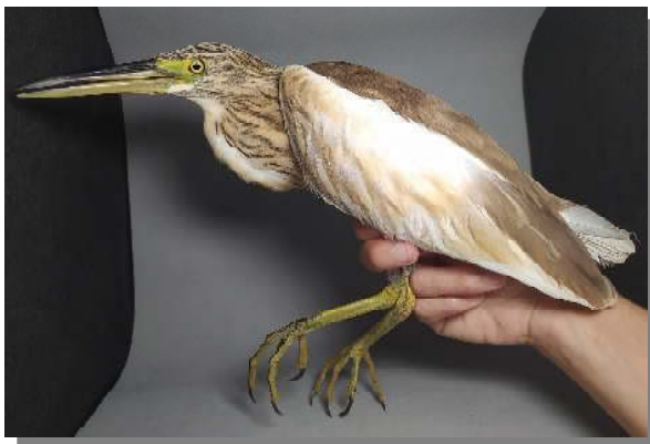
Garcilla cangrejera. Juvenil (14-IX)