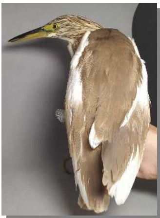
Garcilla cangrejera. Diseño del dorso: arriba izquierda adulto (27-VII); arriba derecha 2º año (); izquierda juvenil (14-IX)