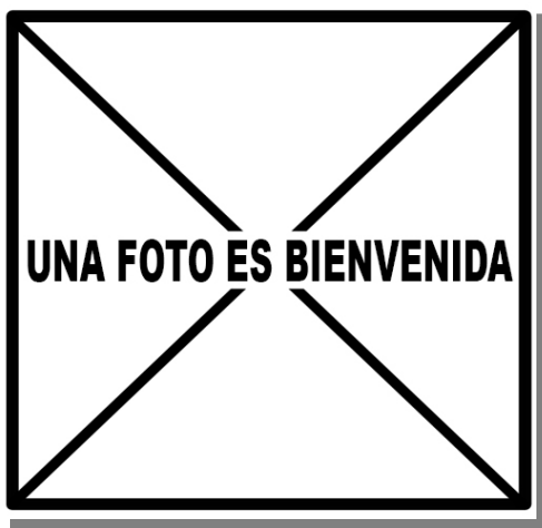
Garcilla cangrejera. 2º año: diseño de coberteras primarias ().