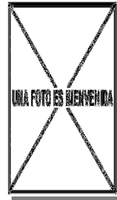
Garcilla cangrejera. Diseño del pecho: arriba izquierda adulto (26-VII); arriba derecha 2º año (); izquierda juvenil ().