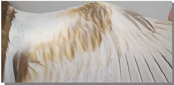
Garcilla cangrejera. Juvenil: diseño de las coberteras del ala (14-IX)