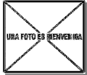
Garcilla cangrejera. Diseño del pecho: arriba izquierda adulto (26-VII); arriba derecha 2º año (); izquierda juvenil ().