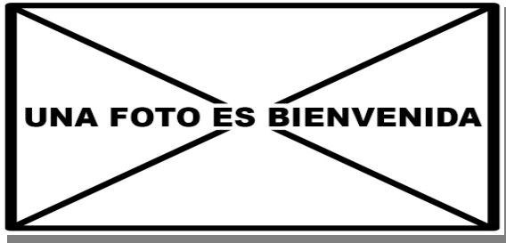
Garcilla cangrejera. 2º año: diseño de las coberteras del ala ().