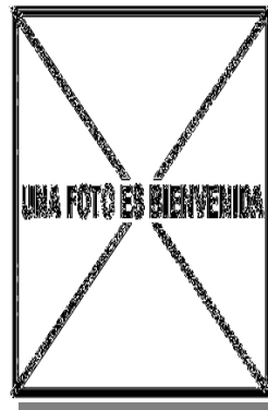
Garcilla cangrejera. Diseño del píleo: arriba izquierda adulto (02-VII); arriba derecha 2º año (); izquierda juvenil ().