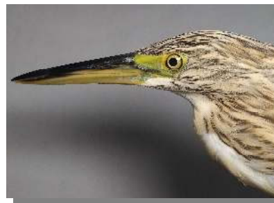
Garcilla cangrejera. Determinación de la edad. Diseño de la cabeza y color del pico: arriba adulto; centro 2º año ; abajo juvenil