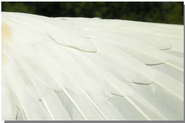
Garcilla cangrejera. Adulto: diseño de coberteras primarias (26-VII).