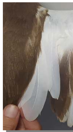
Garcilla cangrejera. Diseño de terciarias: arriba izquierda adulto (26-VII); arriba derecha 2º año (); izquierda juvenil (14-IX)