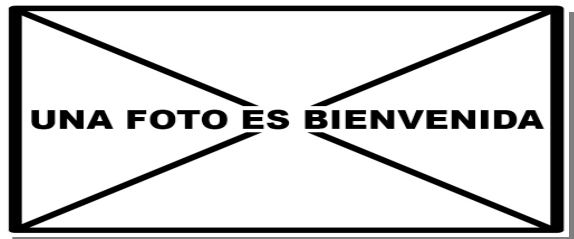
Garcilla cangrejera. Juvenil: diseño del ala (14-IX)