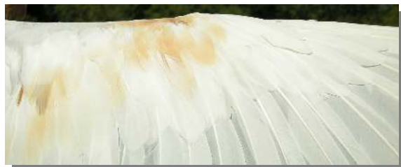
Garcilla cangrejera. Adulto: diseño de las coberteras del ala (26-VII).