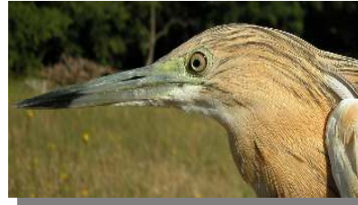
Garcilla cangrejera. Determinación de la edad. Diseño de la cabeza y color del pico: arriba adulto (02-VII); centro 2º año (); abajo juvenil (14-IX)