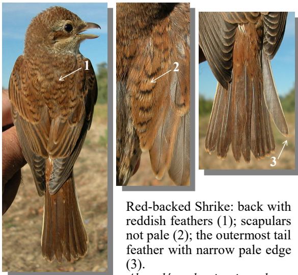
Red-backed Shrike: back with reddish feathers (1); scapulars not pale (2); the outermost tail feather with narrow pale edge (3).

Los juveniles pueden ser separados por el diseño del dorso, las escapulares y la pluma más externa de la cola.