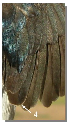
Ageing. Adult. Plumage pattern and bill colour: bright glossy blue head (1) and mantle (2); dark base of bill (3); tertials without white tips (4).

Edad. Adulto. Diseño del plumaje y color del pico: cabeza (1) y dorso (2) de color azul brillante; base del pico oscura (3); terciarias sin punta blanca (4).