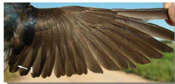
Ageing. Adult. Wing pattern: tertials without white tips (1); worn feathers (04-VI).

Edad. Juvenil. Diseño del plumaje y color del pico: cabeza (1) y dorso (2) de color gris apagado; base del pico clara (3); terciarias con punta blanca (4).