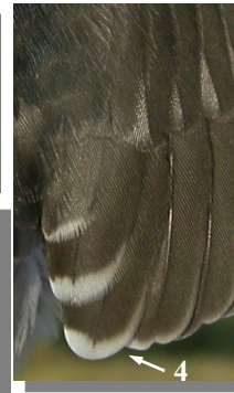
Ageing. Juvenile. Plumage pattern and bill colour: dull greyish head (1) and mantle (2); pale base of bill (3); tertials with white tips (4).

Edad. Juvenil. Diseño del plumaje y color del pico: cabeza (1) y dorso (2) de color gris apagado; base del pico clara (3); terciarias con punta blanca (4).