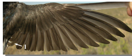
Ageing. Juvenile. Wing pattern: tertials with white tips (1); fresh feathers (21-VIII).

Edad. Adulto. Diseño del ala: terciarias sin punta blanca (1); plumas desgastadas (04-VI).