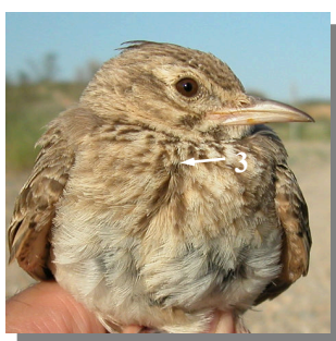
Ageing. Spring. Adult. Plumage pattern: worn plumage; prominent crest (1); feathers on mantle without white edges (2); streaked breast (3).

Edad. Primavera. Adulto. Diseño del plumaje: plumaje desgastado; cresta marcada (1); plumas del dorso sin bordes blancos (2); pecho listado (3).