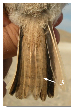
Ageing. Spring. Juvenile. Plumage pattern: fresh tertials (1); wing coverts with broad pale edges (2); fresh tail feathers (3) (08-VII).

Edad. Primavera. Juvenil. Diseño del plumaje: terciarias nuevas (1); coberteras del ala con bordes claros anchos (2); plumas de la cola nuevas (3) (08-VII).