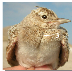
Ageing. Spring. Juvenile. Plumage pattern: fresh plumage; short crest (1); feathers on mantle with white edges (2); breast with fluffy feathers (3).

Edad. Primavera. Juvenil. Diseño del plumaje: plumaje nuevo; cresta corta (1); plumas del dorso con bordes blancos (2); pecho con plumaje esponjoso (3).