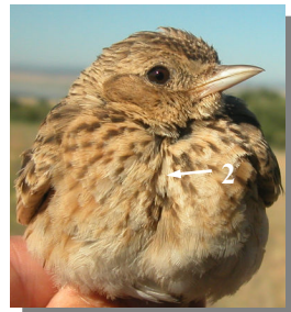
Ageing. Spring. Adult. Plumage pattern: worn plumage; feathers on mantle without white edges (1); streaked breast (2).

Edad. Primavera. Adulto. Diseño del plumaje: plumaje desgastado; plumas del dorso sin