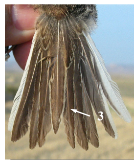
Ageing. Spring. Juvenile. Plumage pattern: fresh tertials (1); wing coverts with broad white edges (2); fresh tail feathers (3) (15-VII).

Edad. Primavera. Juvenil. Diseño del plumaje: terciarias nuevas (1); coberteras del ala con bordes blancos anchos (2); plumas de la cola