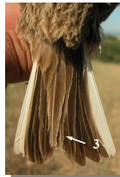
Ageing. Spring. Adult. Plumage pattern: worn tertials (1); wing coverts without white edges (2); worn tail feathers (3) (16-VI).

Edad. Primavera. Adulto. Diseño del plumaje: terciarias desgastadas (1); coberteras del ala sin bordes blancos (2); plumas de la cola desgastadas (3) (16-VI)