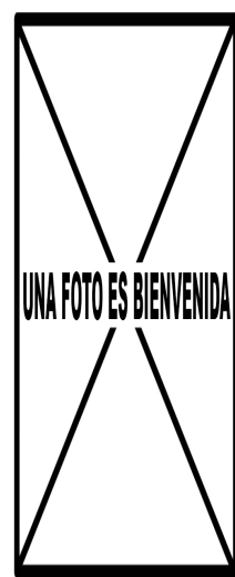
Picamaderos negro. 2º año. Diseño del dorso: izquierda macho (); derecha hembra ().