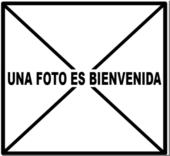
Picamaderos negro. 2º año. Hembra: diseño de secundarias ().