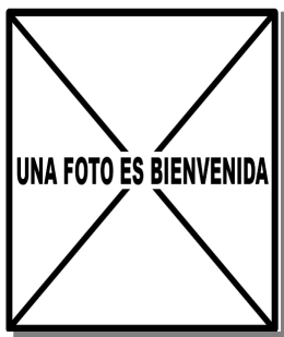
Picamaderos negro. Adulto. Diseño del pecho: izquierda macho (); derecha hembra ().