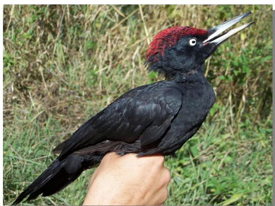
Picamaderos negro. 2º año. Macho (19-III).