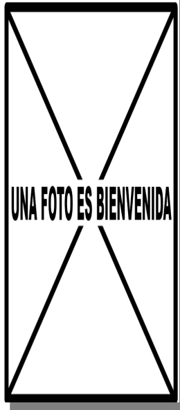
Picamaderos negro. 2º año. Diseño de terciarias: izquierda macho (); derecha hembra ().