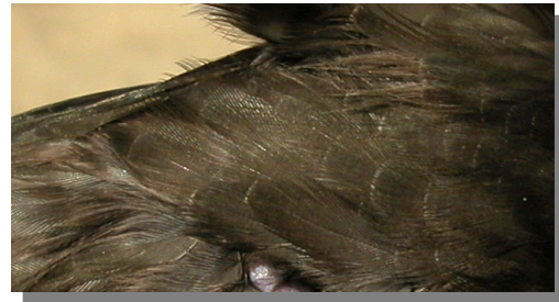
Vencejo común. Diseño del flanco: plumas con borde blanco en la punta poco marcado.