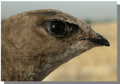
Vencejo pálido. Diseño de la cabeza: cabeza clara con mancha oscura alrededor del ojo bien marcada.