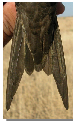
Vencejo común. Diseño de la cola: con horquilla larga.