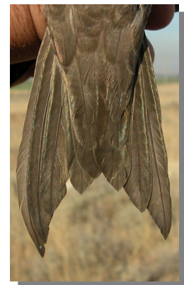
Vencejo pálido. Diseño de la cola: con horquilla corta.