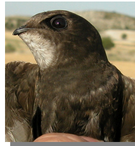
Vencejo común. Tono del plumaje: plumas bastante oscuras.