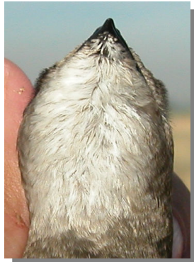
Vencejo pálido. Diseño de la garganta: mancha blanca grande.