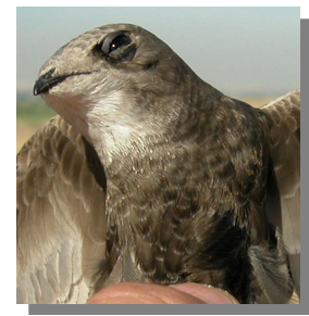
Vencejo pálido. Tono del plumaje: plumas bastante claras.