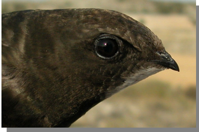
Vencejo común. Diseño de la cabeza: cabeza oscura con mancha oscura alrededor del ojo poco conspicua.

Revisar el diseño de la cabeza, la mancha clara de la garganta, diseño del flanco, el color del plumaje, diseño de la cola y fórmula alar.