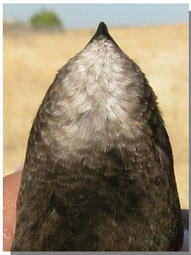
Vencejo común. Diseño de la garganta: mancha blanca pequeña.