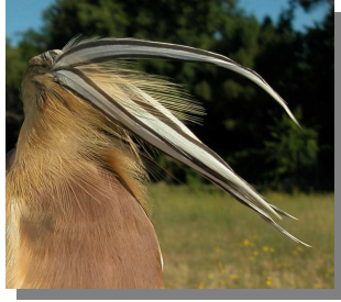
Garcilla cangrejera. Adulto: diseño de la nuca (26-VII).