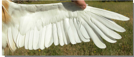
Garcilla cangrejera. Adulto: diseño del ala (26-VII).