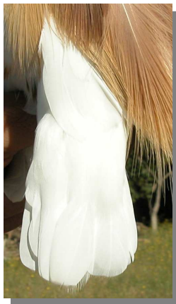
Garcilla cangrejera. Adulto: diseño de la cola (26-VII).