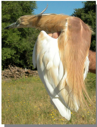
Garcilla cangrejera. Adulto: diseño del dorso (26-VII).