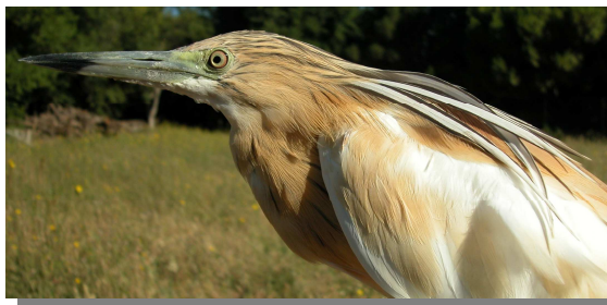
Garcilla cangrejera. Adulto: diseño de la cabeza (26-VII).

Estival, con aves reproductoras muy escasas en puntos del río Ebro y Sariñena.