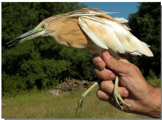
Garcilla cangrejera. Adulto (26-VII).

GARCILLA CANGREJERA ( Ardeola ralloides )