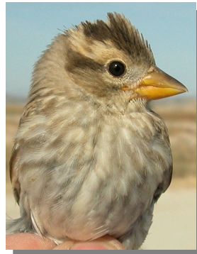
Gorrión chillón. Diseño del pecho: arriba izquierda en invierno (21-XII); arriba derecha adulto en verano (03-VII); izquierda juvenil (27-VI).