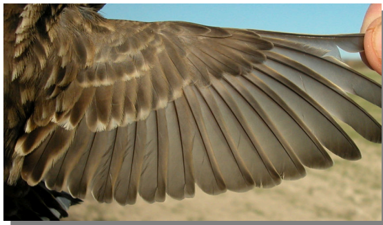
Gorrión chillón. Ala en invierno (21-XII)

Gorrión chillón. Desgaste y diseño de la cola: arriba izquierda en invierno (21-XII); arriba derecha adulto en verano (03-VII); izquierda juvenil (27-VI).