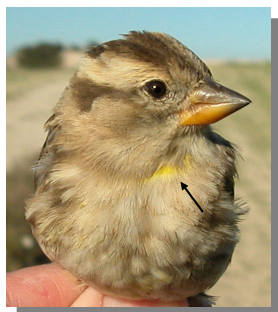
Gorrión chillón. Diseño del pecho y cola.

14-16 cm. Dorso pardo, con estrías pardas; partes inferiores blancas, con estrías marrón-gris; cabeza con lista superciliar clara; cola parda, con círculos blancos en las plumas laterales; mancha amarilla en la parte superior del pecho; pico fuerte y amarillento.