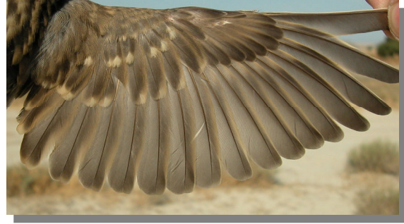
Gorrión chillón. Verano. Juvenil: diseño del ala (27-VI).