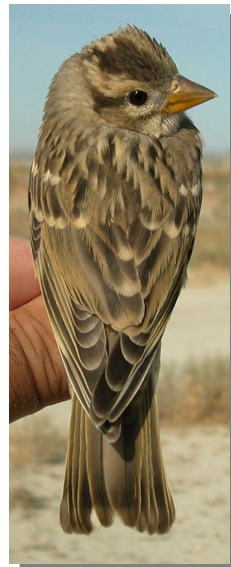
Gorrión chillón. Desgaste y diseño del dorso: arriba izquierda en invierno (21-XII); arriba derecha adulto en verano (03-VII); izquierda juvenil (27-VI).