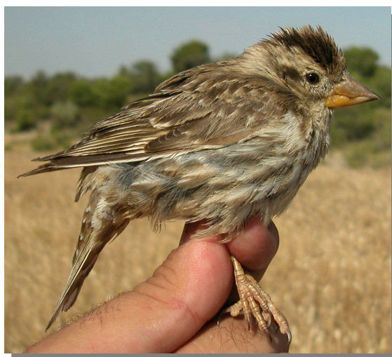
Gorrión chillón. Verano. Adulto (03-VII).

Sedentario. Repartido por toda la Comunidad faltando en las áreas más montañosas y zonas deforestadas de la Depresión del Ebro.