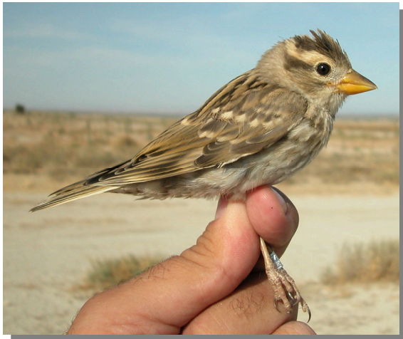
Gorrión chillón. Verano. Juvenil (27-VI).