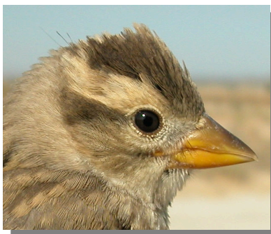
Gorrión chillón. Diseño de la cabeza: arriba en invierno (21-XII); centro adulto en verano (03-VII); abajo juvenil (27-VI).