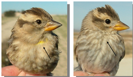
Gorrión chillón. Determinación de la edad. Diseño del pecho: izquierda adulto; derecha juvenil..

Después de las mudas postnupcial/postjuvenil no es posible datar la edad utilizando el diseño del plumaje.