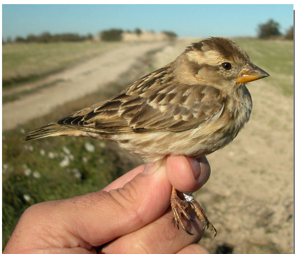
Gorrión chillón. Invierno (21-XII)