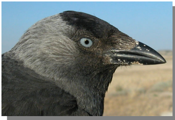
Grajilla. Diseño de la cabeza y cuello

30-31 cm. Plumaje de color negro, con parte superior de la cabeza y cuello grises; pico y patas negras.