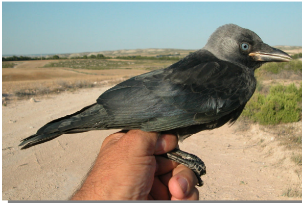
Grajilla. Juvenil (28-VI).

Grajilla. Diseño del pecho: arriba adulto (12-VI); centro 2º año (11- III); abajo juvenil (28- VI)