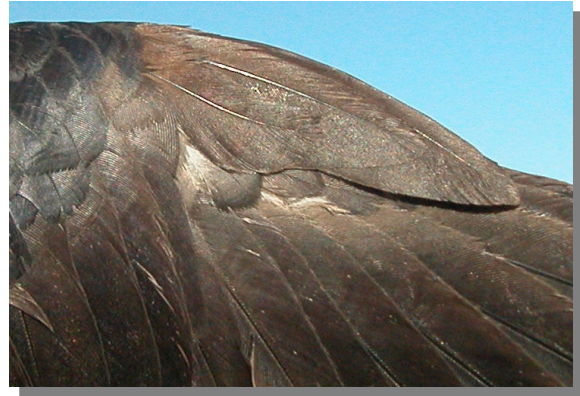
Grajilla. 2º año: diseño del álula (11-III).