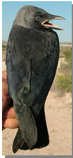
Grajilla. Diseño del dorso: arriba izquierda adulto (28-V); arriba derecha 2º año (11-III); izquierda juvenil (28-VI)