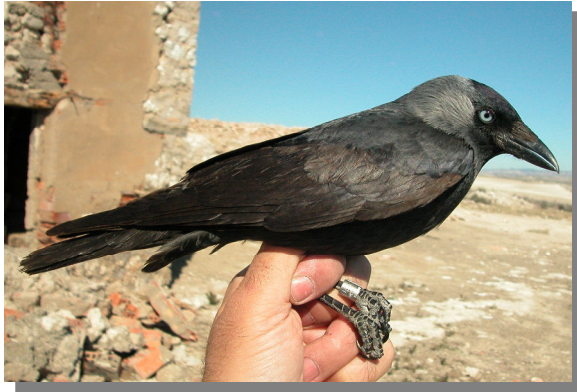
Grajilla. 2º año (11-III).