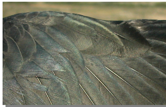
Grajilla. Juvenil: diseño del álula (28-VI).