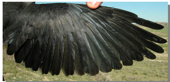
Grajilla. Adulto: diseño del ala (27-IV).