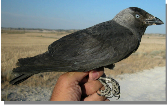
Grajilla. Adulto (28-V).

GRAJILLA OCCIDENTAL ( Coloeus monedula )