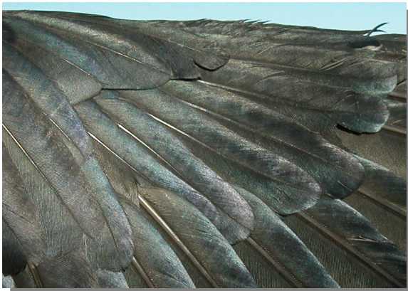
Grajilla. Adulto: diseño del álula (27-IV).