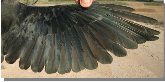
Grajilla. Juvenil: diseño del ala (28-VI).