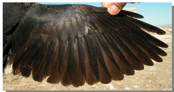
Grajilla. 2º año: diseño del ala (11-III).