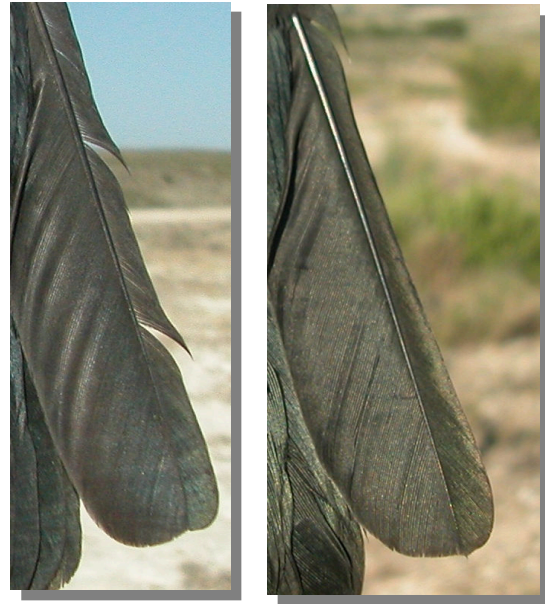
Grajilla. Determinación de la edad. Diseño de la punta de la pluma más externa de la cola: izquierda adulto; derecha juvenil.

Adulto con el plumaje negro brillante y poco desgastado en alas y cola, sin límites de muda; punta de la pluma externa de la cola truncada; píleo oscuro contrastando con la nuca.