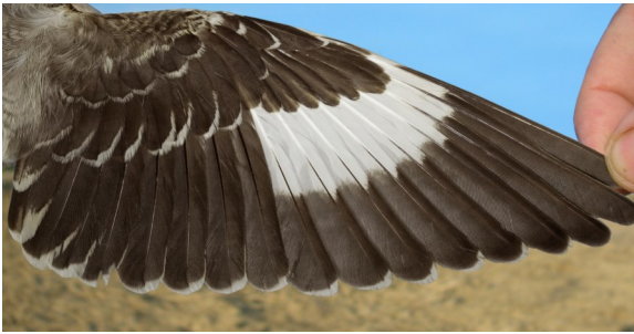
Alcaudón chico. Primavera. Juvenil: diseño del ala (25-VIII).