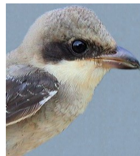
Alcaudón chico. Primavera. Diseño del pecho: arriba izquierda macho (05-V) (Foto: Reinhard Vohwinkel); arriba derecha hembra (11-VII); izquierda juvenil (25-VIII) (Foto: Reinhard Vohwinkel).