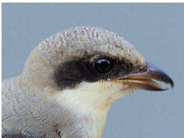
Alcaudón chico. Primavera. Diseño de la cabeza: arriba macho (05-V) (Foto: Reinhard Vohwinkel); centro hembra (11-VII); abajo juvenil (25-VIII) (Foto: Reinhard Vohwinkel).