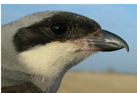
Alcaudón chico. Diseño del ala, cabeza y frente.