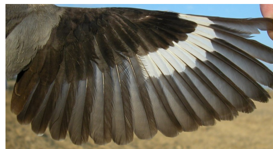
Alcaudón chico. Primavera. Adulto. Hembra: diseño del ala (11-VII).