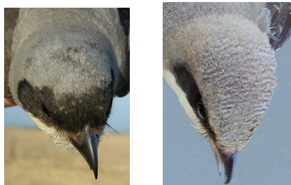
Alcaudón chico. Determinación de la edad. Diseño de la frente: izquierda adulto hembra; derecha juvenil.