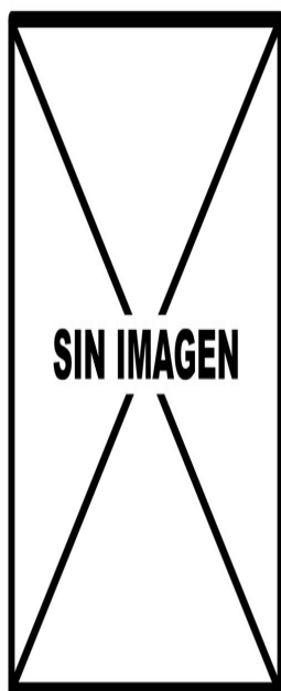
Alcaudón chico. Determinación de la edad. Diseño del dorso: izquierda adulto hembra; derecha juvenil.