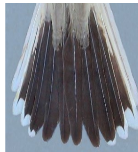
Alcaudón chico. Primavera. Diseño de la cola: arriba izquierda macho (05-V) (Foto: Reinhard Vohwinkel); arriba derecha hembra (11-VII); izquierda juvenil (25-VIII) (Foto: Reinhard Vohwinkel).