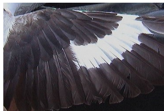
Alcaudón chico. Primavera. Adulto. Macho: diseño del ala (05-V).