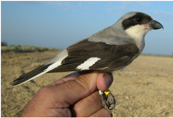
Alcaudón chico. Primavera. Adulto. Hembra (11-VII).