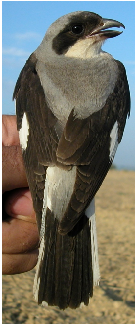
Alcaudón chico. Primavera. Diseño del dorso: arriba izquierda macho (); arriba derecha hembra (11-VII); izquierda juvenil ().