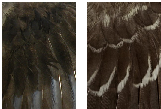
Alcaudón chico. Determinación de la edad. Diseño de coberteras del ala: izquierda adulto; derecha juvenil (Foto: Ralph Lösekrug).

Adulto con plumaje desgastado; manto sin barrado, de color gris uniforme; con una banda negra en la frente; lados del pecho y flancos sin barrado gris; grandes coberteras negro uniforme.