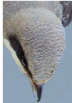
Alcaudón chico. Primavera. Diseño del píleo: arriba izquierda macho (05-V) (Foto: Reinhard Vohwinkel); arriba derecha hembra (11-VII); izquierda juvenil (25-VIII) (Foto: Reinhard Vohwinkel).