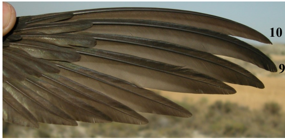
Vencejo común. Fórmula alar: generalmente 9ª primaria más larga que la 10ª.