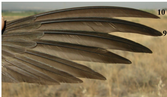
Vencejo pálido. Fórmula alar: generalmente 9ª primaria de la misma longitud que la 10ª.