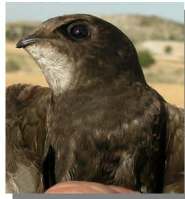
Vencejo común. Tono del plumaje: plumas bastante oscuras.