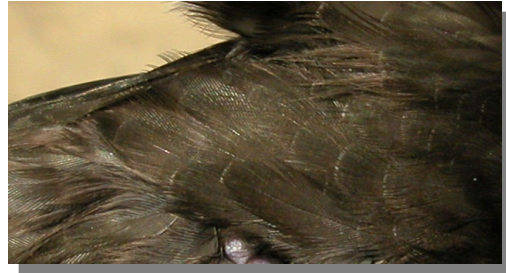
Vencejo común. Diseño del flanco: plumas con borde blanco en la punta poco marcado.